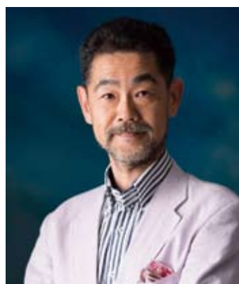
一般社団法人 日本セレンディピティ協会代表理事

2010年、偶然、悪性リンパ腫（血液の癌）になりステージ4、死亡確率75%と宣告される。